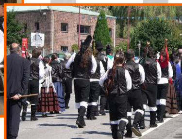
Día da Asturianía, pasarrúas e actuación. Riaño-Langreo

- II Foliada de Sada e I Concurso de baile tradicional por parellas. Sada. 07/11/2009.