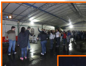
II Foliada de Sada