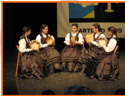
X Concurso de Música tradicional Xiradela.

- X Concurso de Música tradicional: Asociación xuvenil Xiradela. 2º premio categoría B de pandeireta (Grupo "Morazón"). 19/04/2009.