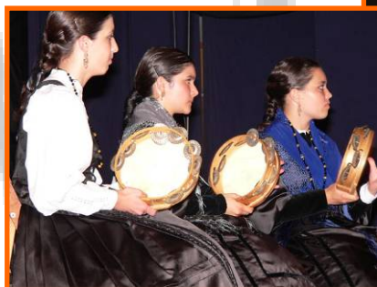
Festival "Ó noso ritmo"