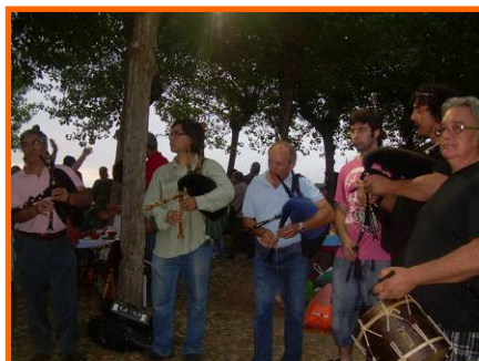
Sardiñada das Festas 2009

- Sardiñada das Festas 2009: Concello de Sada. 18/08/2009.