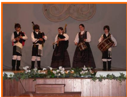
XX Concurso de Música tradicional Xacarandaina.

- XXII Concurso de Música tradicional: Agrupación Cántigas e agarimos. 21/06/2009.