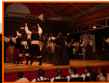
III Encontro Folclórico Frouma