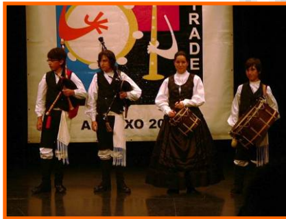
X Concurso de Música tradicional Xiradela.

- X Concurso de Música tradicional: Asociación xuvenil Xiradela. 3º premio categoría cuartetos (Grupo "Rebordechaos"). 05/04/2009.