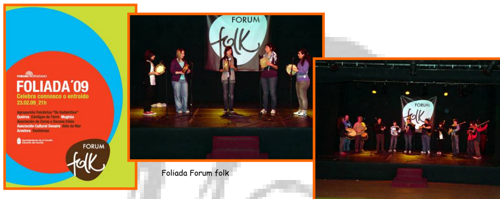
Foliada Forum folk

- Foliada ForumFolk: Forum Metropolitano da Coruña. 23/02/2009.