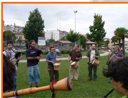
Ensaio na rúa

- Ensaio na rúa: Concello de Sada. 10, 17, 24 e 31/07/2009.