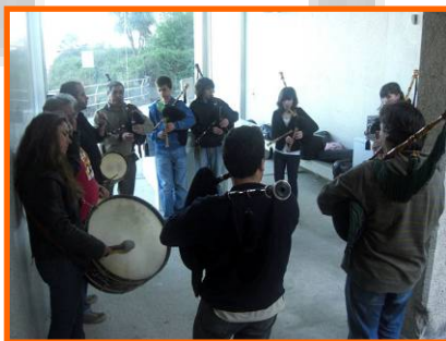
Marcha Mundial pola Paz e a Non-violencia

- Marcha Mundial pola Paz e a Non-violencia: Fundación Luis Seoane. A Coruña. 21/03/2009.