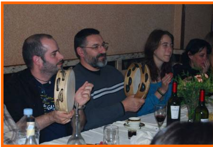
Festa de inverno